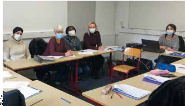
Les Greta sont des structures de l'Éducation nationale qui organisent des formations pour adultes. Leur force : faire du sur-mesure.