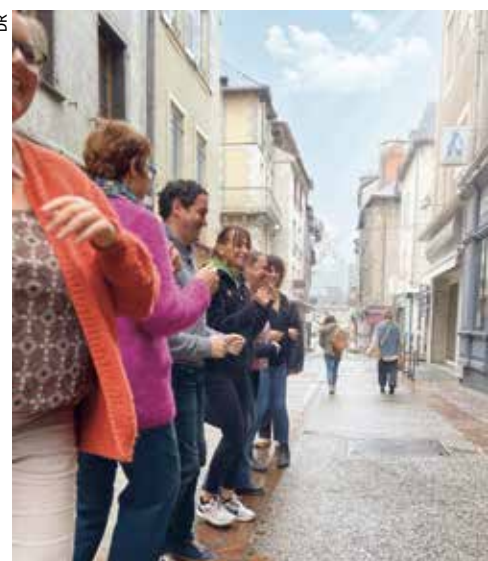
Danse du brise-pied dans la rue.

Cette année, ces artisans et commerçants, unis malgré toutes les